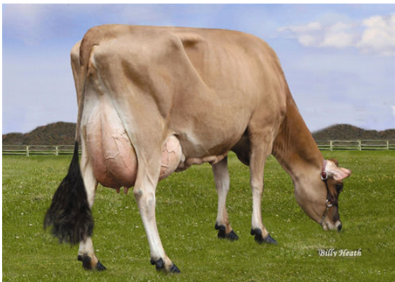
LUCKY HILL JOKER WABORITA