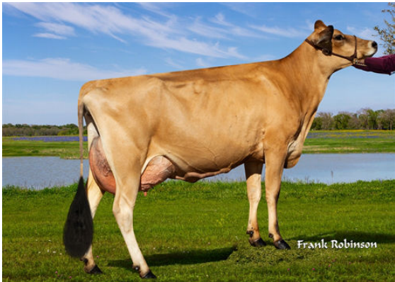
JX LUCKY HILL WILDFLOWER {6}